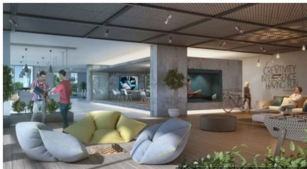
Enterijer render Business Garden

Takođe, većina poslovnih zgrada i onih koje su preuređene za tu namenu, ne mogu da se pohvale ni velikim brojem (a često i bilo kakvim) parking mesta. Zaposleni Beograđani najbolje znaju da pronalazak mesta za parkiranje traje predugo, a često i prilično košta.